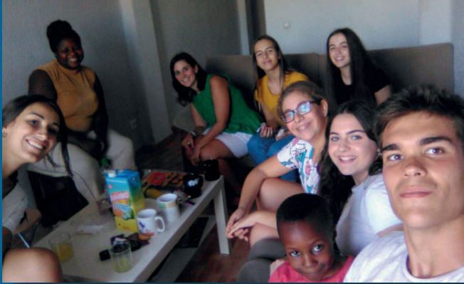
Un grupo de voluntarios en una de las casas de Málaga