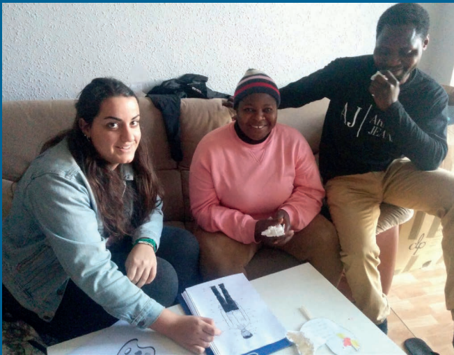
Clases de español en nuestras casas