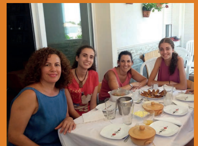
Los chicos del CTL en un encuentro con una familia