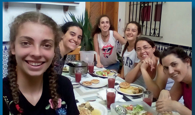
Jóvenes en nuestra casa San Vicente