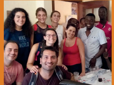
Los chicos del Campo de Trabajo Lázaro