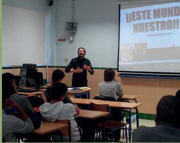
Sensibilización en los institutos