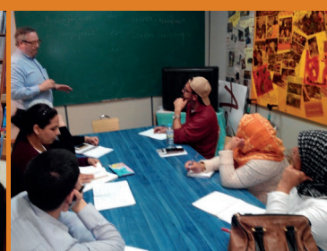
En clases de Alfabetización