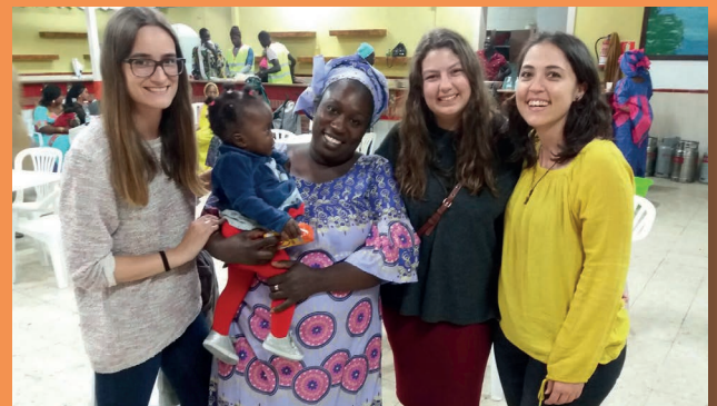
Encuentro con los senegaleses en Fuengirola