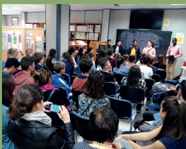
Charla sobre inmigración a alumnos Erasmus