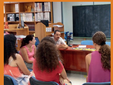
Charla en la sede de Asís a los chicos del CTL