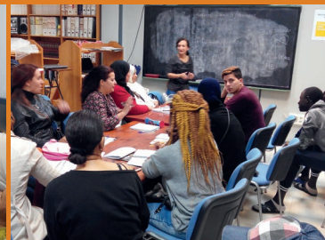
Clases de español