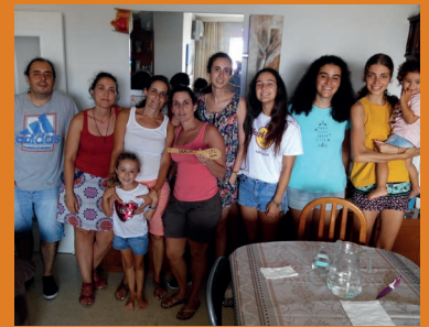
Jóvenes del CTL

En verano participamos en la experiencia del CAMPO DE TRABAJO LÁZARO, organizado por la Delegación de Infancia y Juventud de la Diócesis de Málaga, a través de una experiencia fuerte de voluntariado, encuentros, formaciones en acción social.