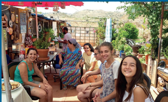
Voluntarios en una de las visitas