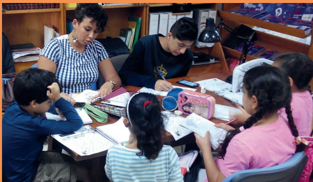
Los niños del apoyo socioeducativo