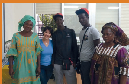
Con los alumnos de español en Fuengirola