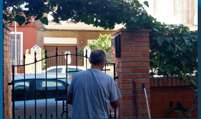
Realizando tareas de mantenimiento en la casa San Vicente