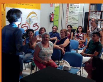
Taller sobre violencia de Género