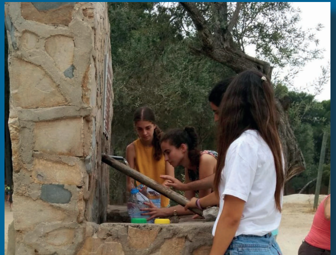
Jóvenes recogiendo agua para una mujer