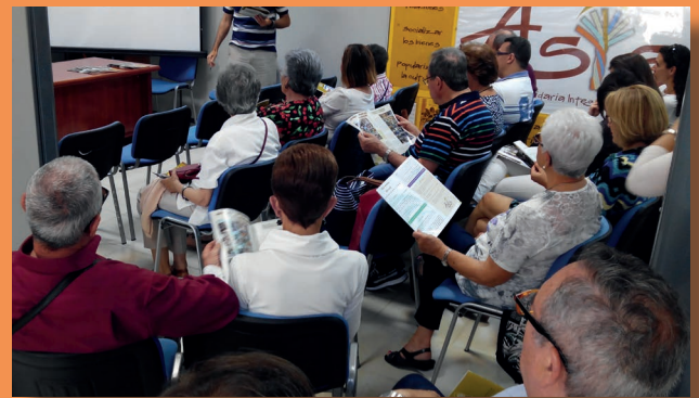
Encuentro de socios 2017