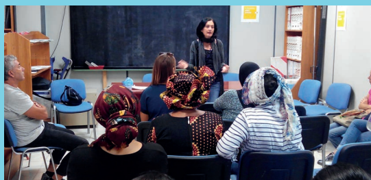
Compañera de Bancosol impartiendo una charla de Inclusión Sociolaboral