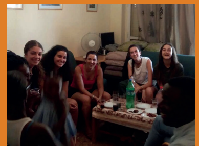
Encuentro de los jóvenes y voluntarios del CTL con los chicos senegaleses

Subvencionado por la Junta de Andalucía, Consejería de Igualdad, Salud y Políticas Sociales, Delegación territorial en Málaga, de julio a diciembre.