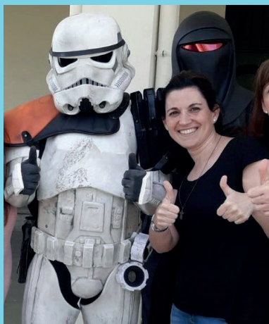
Exhibición de la Legión 501 en el Colegio La Asunción a beneficio de ASÍS