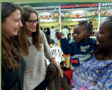
En un encuentro con los senegaleses