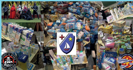
Exhibición de la Legión 501 en el Colegio La Asunción a beneficio de ASÍS