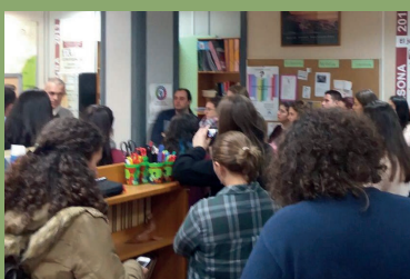
Voluntarios en el centro social en una formación con el Presidente

Llegamos a más de 500 jóvenes a través de exposiciones y campañas de sensibilización en institutos de enseñanza secundaria, jóvenes de edades comprendidas entre los 12 y los 27 años; fomentamos la cultura de la solidaridad, y sensibilizamos a la población ante problemáticas sociales actuales, generando conciencia crítica. Hemos podido dar a conocer a ASIS como oferta de voluntariado en Benalmádena, Málaga y Fuengirola.