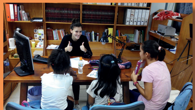
Niños en el apoyo escolar