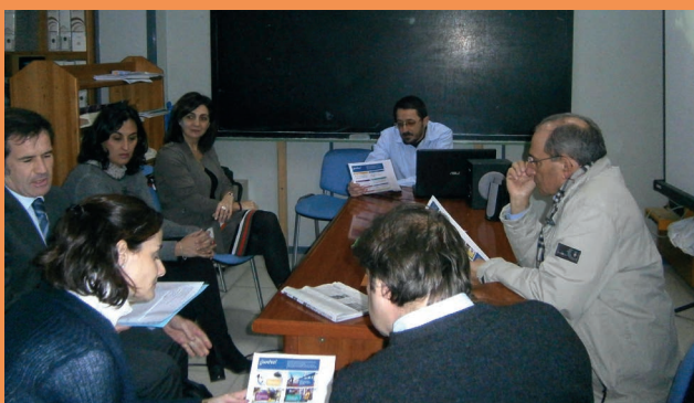
Presentación de nuestro proyecto a los responsables de VINCI